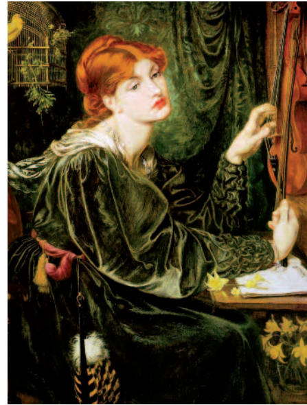
Figura 1. Veronica Veronese , de Dante Gabriel Rossetti (1828-1882).

Pongamos un ejemplo. Paseemos entre las pinturas de Dante Gabriel Rossetti (fig. 1), John Everett Millais (fig. 2) o William Holman Hunt (fig. 3). Además del placer de la belleza y la posibilidad de sufrir el síndrome de Stendhal, podremos deducir que estos pintores tenían mucho en común: una época (segunda mitad del siglo XIX y principios del XX), una técnica realista y minuciosa, y un colorido luminoso. Naturalmente, estos nexos de unión justificaron la creación, en 1848, de la Hermandad Prerrafaelita, en la que pintores, poetas y críticos ingleses propugnaban, en