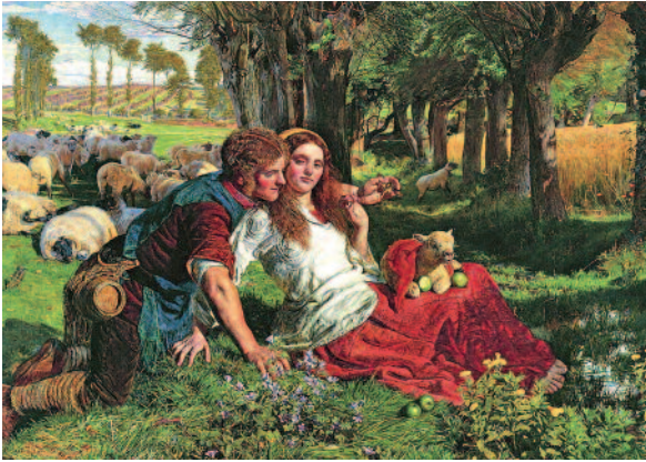
Figura 3. The Hireling Shepherd , de William Holman Hunt (1827-1910).

la pintura, el regreso al detallismo minucioso y a los tintes brillantes de los primitivos italianos y flamencos, anteriores a Rafael.