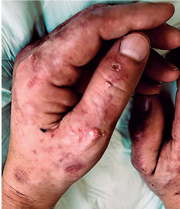
FIGURA 1. Imagen clínica de las lesiones de las manos del paciente.

como primera posibilidad, sin descartar todavía la posibilidad de diagnosticar lupus eritematoso ampolloso o dermatitis facticia (fig. 2).